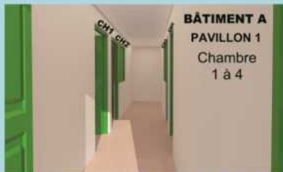
BÂTIMENT A PAVILLON 1 Chambre 1 à 4